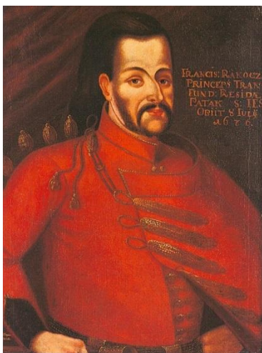
név: I. Rákóczi Ferenc