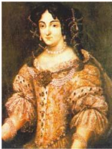
név: Zrínyi Ilona