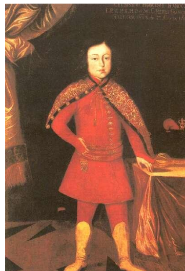
név: II. Rákóczi Ferenc