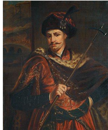
név: Thököly Imre