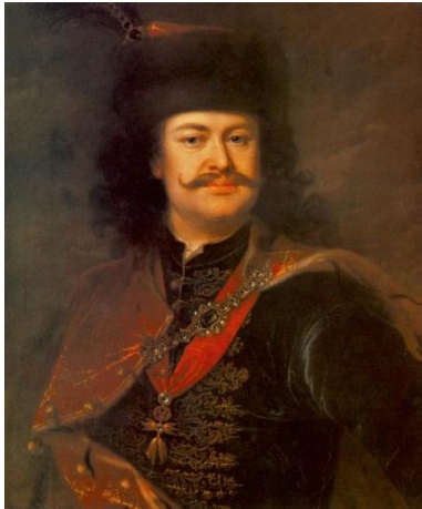
név: II. Rákóczi Ferenc

4. Rákóczi-arcképcsarnok. Kiket ábrázolnak az alábbi – egykorú vagy későbbi – festmények? Vigyázz, egyvalaki kétszer is szerepel! 6 pont/